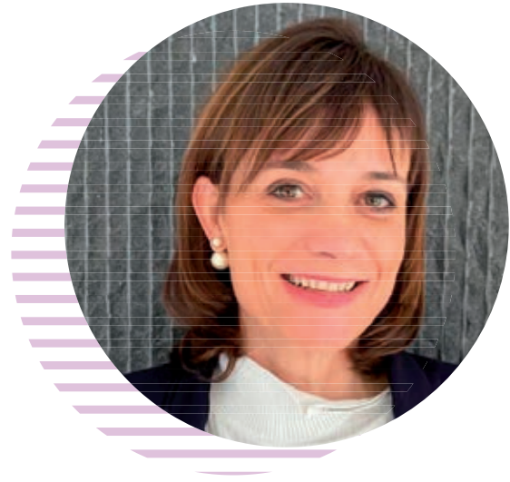
— Directrice Régionale UGECAM Hauts-de-France