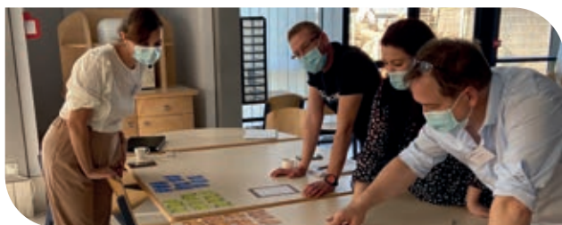
Journée dédiée à la qualité et au contrôle interne en septembre 2020