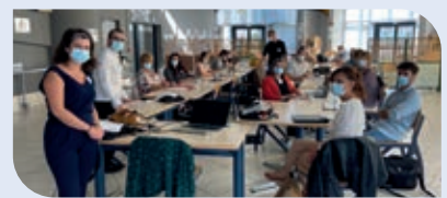
Journée du réseau des référents qualité septembre 2020

Le pôle a pour objectif de créer une coordination régionale dans l'intérêt de la prise en charge métier et des interlocuteurs dédiés. Il fait le lien avec la stratégie « qualité » nationale pour déployer les outils communs nationaux. En matière de qualité, l'enjeu prioritaire à l'UGECAM Hauts-de-France est de faciliter le management de la qualité et des risques au sein des établissements, en harmonisant les outils et pratiques au niveau régional et en mettant à disposition des ressources humaines et matérielles.