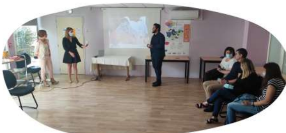
Présentation du projet régional aux personnel du siège

L'enjeu majeur du projet stratégique consiste à placer les personnes accompagnées ou prises en charge au sein de nos dispositifs.