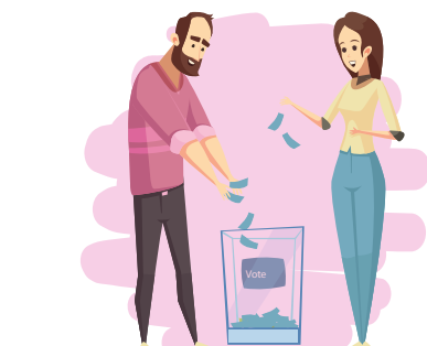
Article 10 Droit à l'exercice des droits civiques attribués à la personne accueillie