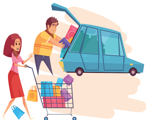
Article 8 Droit à l'autonomie