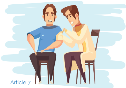
Article 7 Droit à la protection