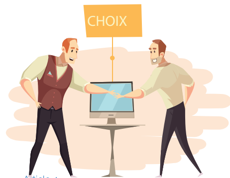
Article 4 Principe du libre choix, du consentement éclairé et de la participation de la personne