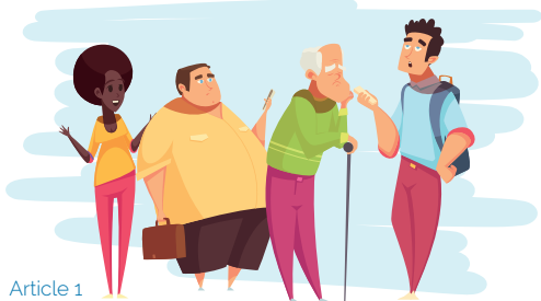
Article 1 Principe de non-discrimination