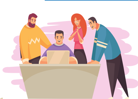
Article 2 Droit à une prise en charge ou à un accompagnement adapté