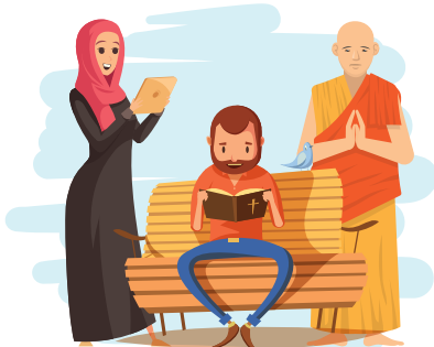
Article 11 Droit à la pratique religieuse