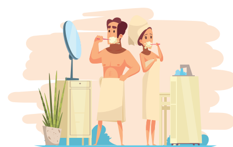
Article 12 Respect de la dignité de la personne et de son intimité