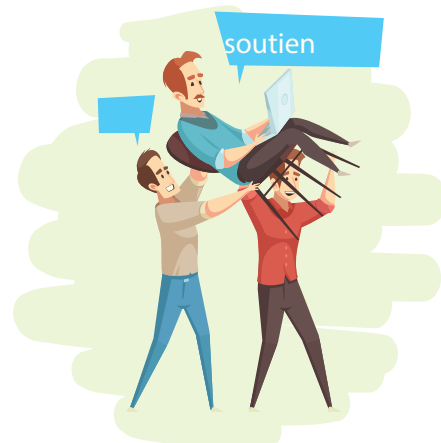
Article 9 Principe de prévention et de soutien