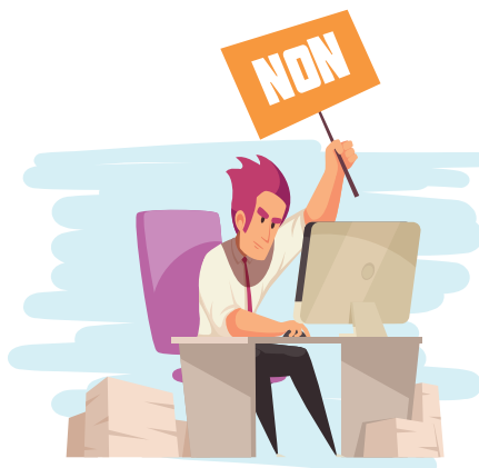
Article 5 Droit à la renonciation